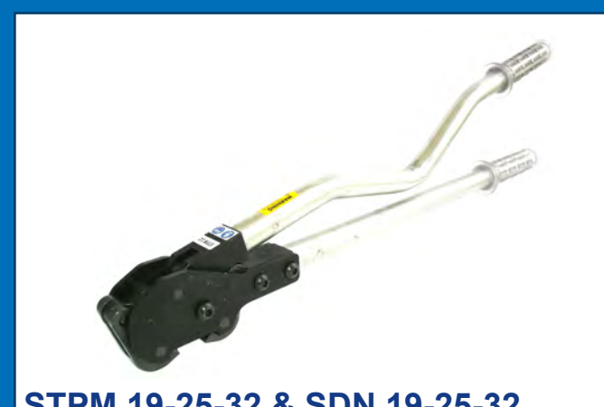
STPM 19-25-32 & SDN 19-25-32